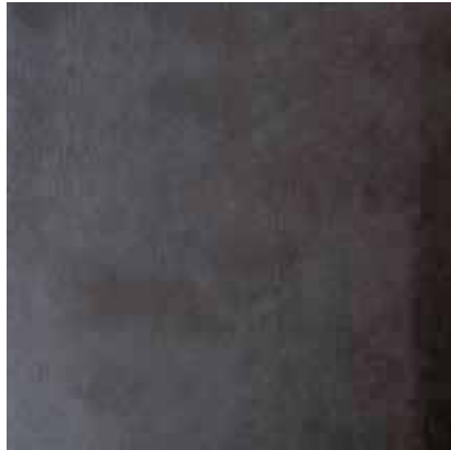
ASTON ANTRACITA S-R 59,6x59,6x1,1cm P1856867 / 100137569 G354 Butech recomienda junta / Butech recommends joint: Colorstuk Rapid n Antracita B22502005 / 100004298