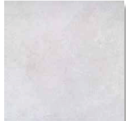
ASTON CALIZA S-R 59,6x59,6x1,1cm P1856866 / 100137601 G354 Butech recomienda junta / Butech recommends joint: Colorstuk Rapid n Gris B22502013 / 100004305