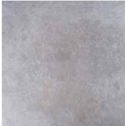
ASTON ACERO S-R 59,6x59,6x1,1cm P1856868 / 100137568 G354 Butech recomienda junta / Butech recommends joint: Colorstuk Rapid n Manhattan B22502002 / 100004295