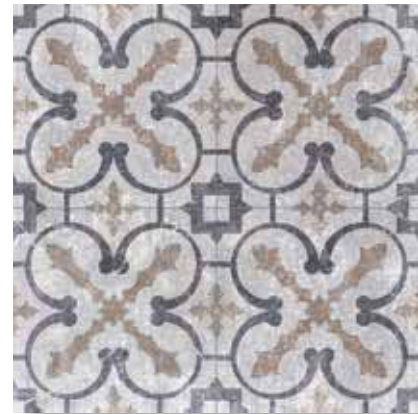
BARCELONA C S-R 59,6x59,6x1,1cm P1856959 / 100155911 G359 Butech recomienda junta / Butech recommends joint: Colorstuk Rapid n Antracita B22502005 / 100004298