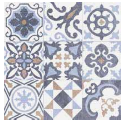
BARCELONA F S-R 59,6x59,6x1,1cm P1856977 / 100161457 G359 Butech recomienda junta / Butech recommends joint: Colorstuk Rapid n Cemento B22502004 / 100004297