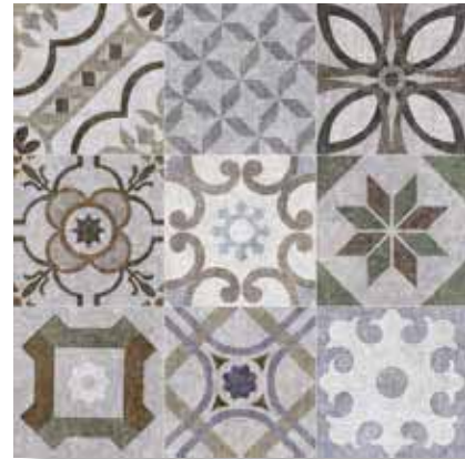
BARCELONA D S-R 59,6x59,6x1,1cm P1856960 / 100155912 G359 Butech recomienda junta / Butech recommends joint: Colorstuk Rapid n Gris B22502013 / 100004305