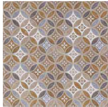
BARCELONA B S-R 59,6x59,6x1,1cm P1856961 / 100155910 G359 Butech recomienda junta / Butech recommends joint: Colorstuk Rapid n Cemento B22502004 / 100004297