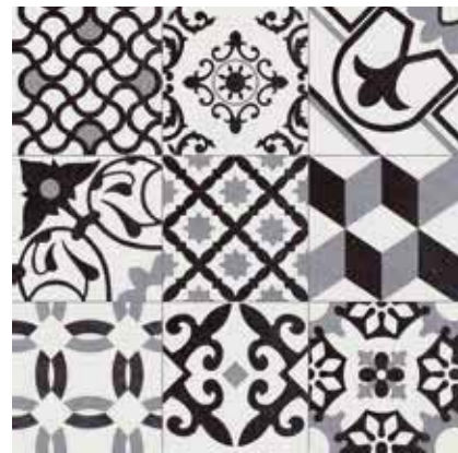
BARCELONA E S-R 59,6x59,6x1,1cm P1856975 / 100161220 G359 Butech recomienda junta / Butech recommends joint: Colorstuk Rapid n Cemento B22502004 / 100004297