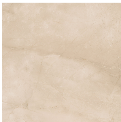
BELIZE SAND PR8080L