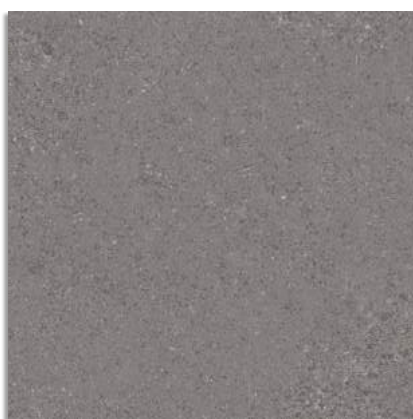
Beta Plomo G.229 Beta-R Plomo G.230