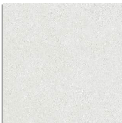
Beta Light G.229 Beta-R Light G.230