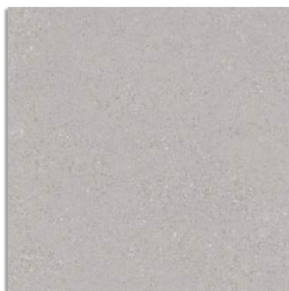
Beta Cemento G.229 Beta-R Cemento G.230