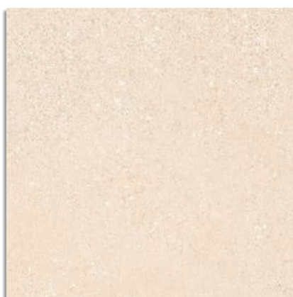
Beta Beige G.229 Beta-R Beige G.230