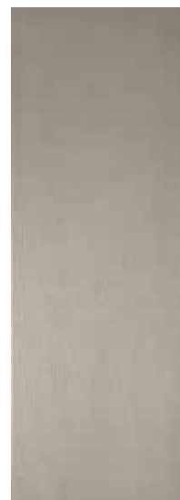
CRAYON SILVER RECT. 31,6X90 / 12,5"X36" T07/M