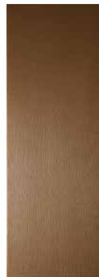
CRAYON BRONZE RECT. 31,6X90 / 12,5"X36" T07/M