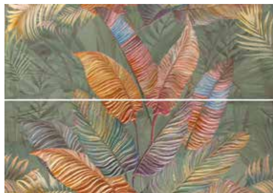
DECOR SET(2) VERGEL 31,6X90 / 12,5"X36" T42/P