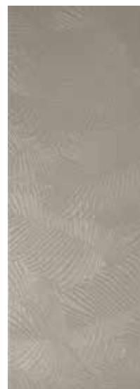
KENTIA SILVER RECT. 31,6X90 / 12,5"X36" T45/M