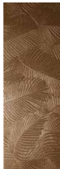
KENTIA BRONZE RECT. 31,6X90 / 12,5"X36" T45/M