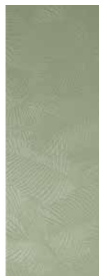
KENTIA GREEN RECT. 31,6X90 / 12,5"X36" T04/M