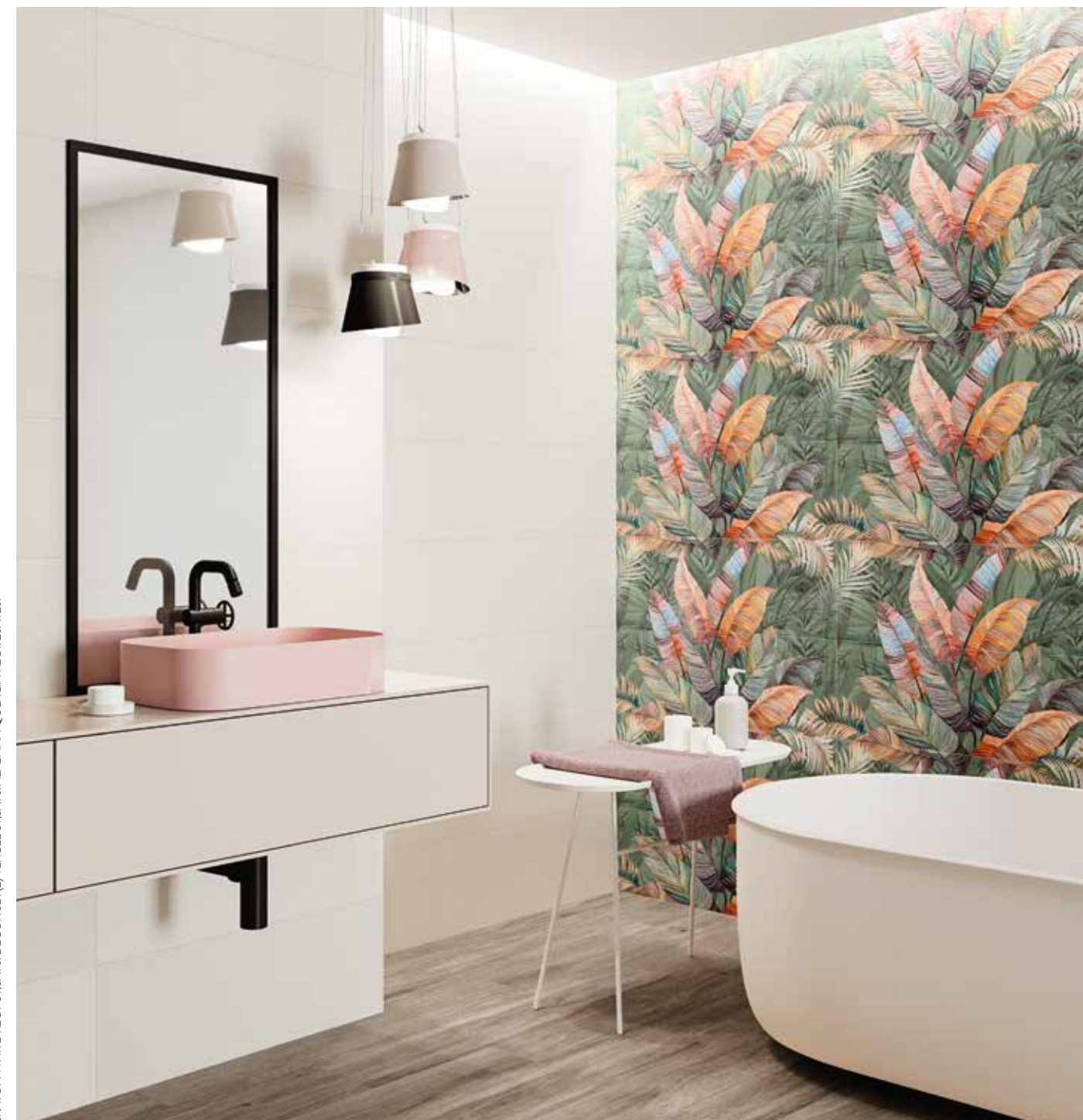
CRAYON WHITE RECT 31,6X90, DECOR SET(2) VERGEL 31,6X90, ALABAMA QUERCIA RECT. 20X120.

V1 ASPECTO UNIFORME / UNIFORM APPEARANCE / APPARENCE UNIFORME