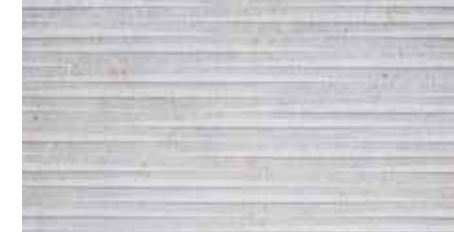
DOVER MODERN LINE ACERO 31,6x59,2x1,14cm P3219281 / 100157373 G233 Butech recomienda junta / Butech recommends joint: Colorstuk Rapid n Gris B22502013 / 100004305