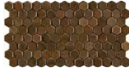
FOREST CHELSEA NUT 31,6x59,2x1,1cm P3219287 / 100173327 G235 Butech recomienda junta / Butech recommends joint: Colorstuk Rapid n Tabaco B22502011 / 100004304