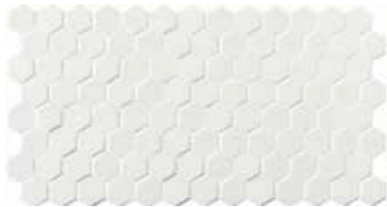
FOREST MARMI CHINA 31,6x59,2x1,1cm P3219285 / 100173334 G235 Butech recomienda junta / Butech recommends joint: Colorstuk Rapid n Blanco B22501001 / 100004294