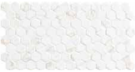
FOREST PERSIA 31,6x59,2x1,1cm P3219295 / 100179117 G235 Butech recomienda junta / Butech recommends joint: Colorstuk Rapid n Blanco B22501001 / 100004294