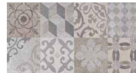
DOVER ANTIQUE 31,6x59,2x0,9cm P3219277 / 100157355 G233 Butech recomienda junta / Butech recommends joint: Colorstuk Rapid n Cemento B22502004 / 100004297