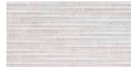
DOVER MODERN LINE CALIZA 31,6x59,2x1,14cm P3219282 / 100157374 G233 Butech recomienda junta / Butech recommends joint: Colorstuk Rapid n Gris B22502013 / 100004305