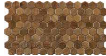
FOREST CHELSEA CAMEL 31,6x59,2x1,1cm P3219289 / 100173326 G235 Butech recomienda junta / Butech recommends joint: Colorstuk Rapid n Tabaco B22502011 / 100004304