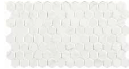
FOREST CARRARA BLANCO 31,6x59,2x1,1cm P3219288 / 100173324 G235 Butech recomienda junta / Butech recommends joint: Colorstuk Rapid n Blanco B22501001 / 100004294