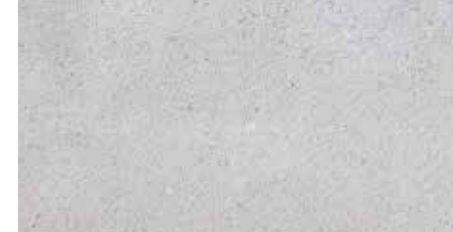
DOVER ACERO 31,6x59,2x0,9cm P3219280 / 100157353 G226 Butech recomienda junta / Butech recommends joint: Colorstuk Rapid n Gris B22502013 / 100004305