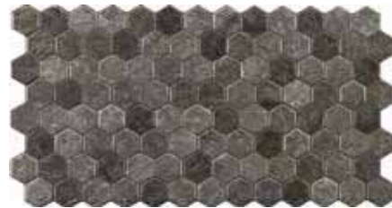
FOREST SLATE 31,6x59,2x1,1cm P3219290 / 100173335 G235 Butech recomienda junta / Butech recommends joint: Colorstuk Rapid n Antracita B22502005 / 100004298