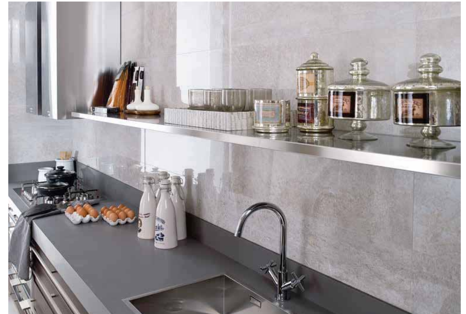
# GLASGOW SILVER 31,6x90cm

PAVIMENTO COMBINABLE: SERIE GLASGOW 43,5x65,9cm · PAG.160 FLOOR TILES COMBINATIONS: GLASGOW SERIES 43,5x65,9cm · PAG.160