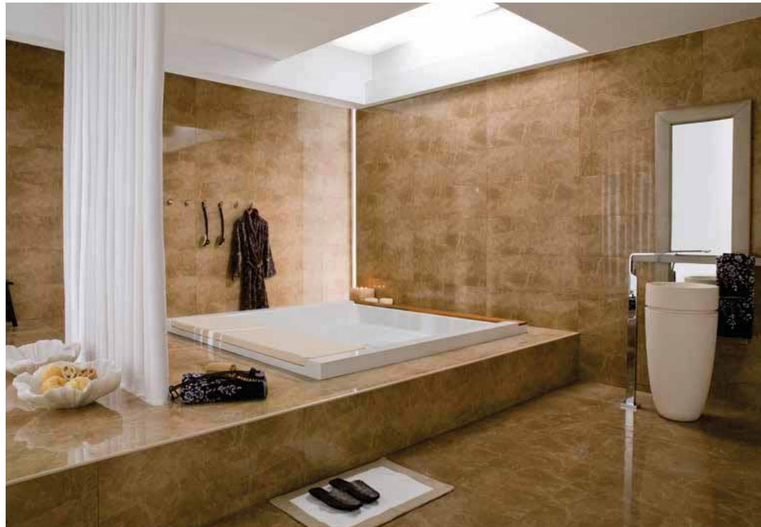
# KALI TABACO 31,6x90cm

PAVIMENTO COMBINABLE: SERIE KALI 43,5x43,5cm · PAG.206 FLOOR TILES COMBINATIONS: KALI SERIES 43,5x43,5cm · PAG.206