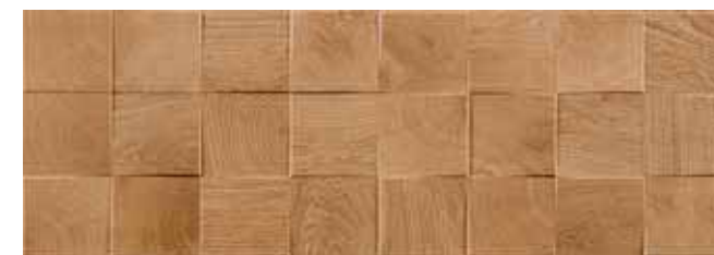
TACO OXFORD NATURAL 31,6x90x1,25cm P3470678 / 100135555 G271 Butech recomienda junta / Butech recommends joint: Colorstuk Rapid n Tabaco B22502011 / 100004304