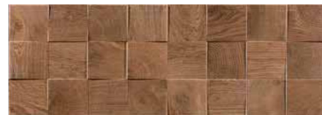
TACO OXFORD COGNAC 31,6x90x1,25cm P3470677 / 100135554 G271 Butech recomienda junta / Butech recommends joint: Colorstuk Rapid n Moka B21522220 / 100060549