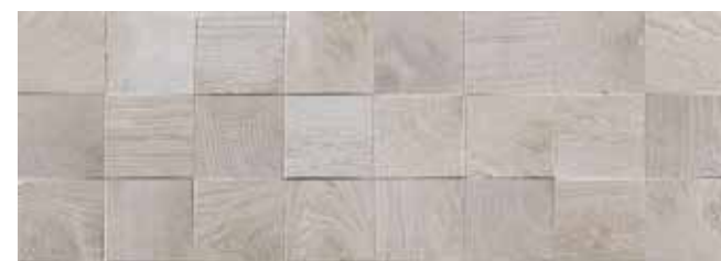
TACO OXFORD ACERO 31,6x90x1,25cm P3470661 / 100135552 G271 Butech recomienda junta / Butech recommends joint: Colorstuk Rapid n Cemento B22502004 / 100004297