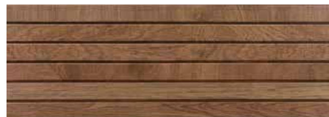
LISTON OXFORD COGNAC 31,6x90x1,1cm P3470662 / 100135534 G271 Butech recomienda junta / Butech recommends joint: Colorstuk Rapid n Moka B21522220 / 100060549