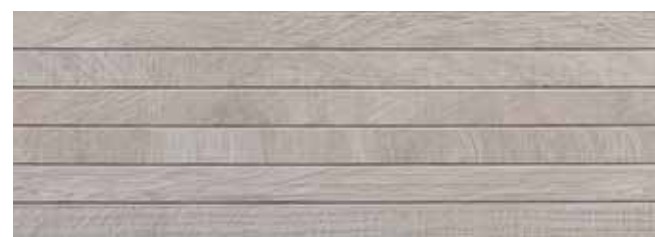
LISTON OXFORD ACERO 31,6x90x1,1cm P3470675 / 100135532 G271 Butech recomienda junta / Butech recommends joint: Colorstuk Rapid n Cemento B22502004 / 100004297