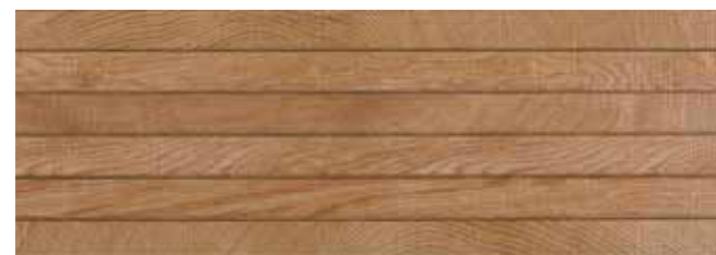
LISTON OXFORD NATURAL 31,6x90x1,1cm P3470657 / 100135535 G271 Butech recomienda junta / Butech recommends joint: Colorstuk Rapid n Tabaco B22502011 / 100004304