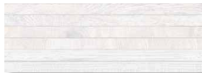
LISTON OXFORD BLANCO 31,6x90x1,1cm P3470671 / 100135533 G271 Butech recomienda junta / Butech recommends joint: Colorstuk Rapid n Gris B22502013 / 100004305