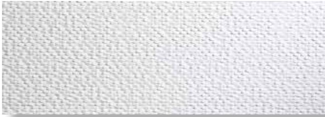
MADISON NÁCAR 31,6x90x0,9cm P3470563 / 100099090 G271 Butech recomienda junta / Butech recommends joint: Colorstuk Rapid n Blanco B22501001 / 100004294