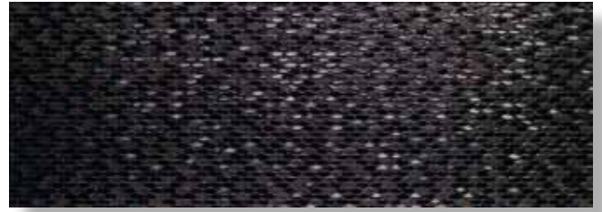
MADISON ANTRACITA 31,6x90x0,9cm P3470574 / 100099872 G271 Butech recomienda junta / Butech recommends joint: Colorstuk Rapid n Negro B22502006 / 100004299