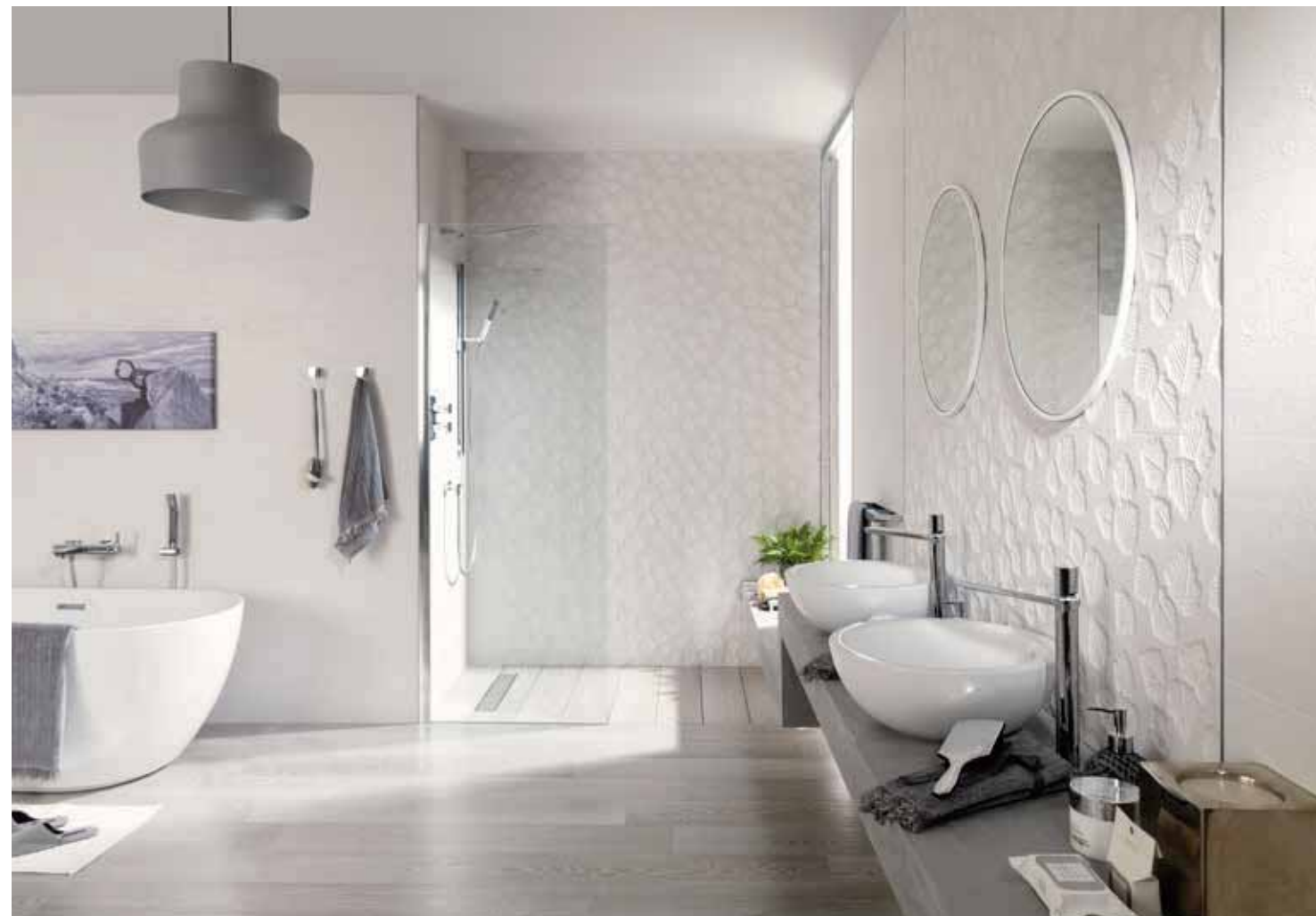
# MANILA BLANCO & MANILA DECO BLANCO 31,6x90cm

*valores aproximados. *approximated values.