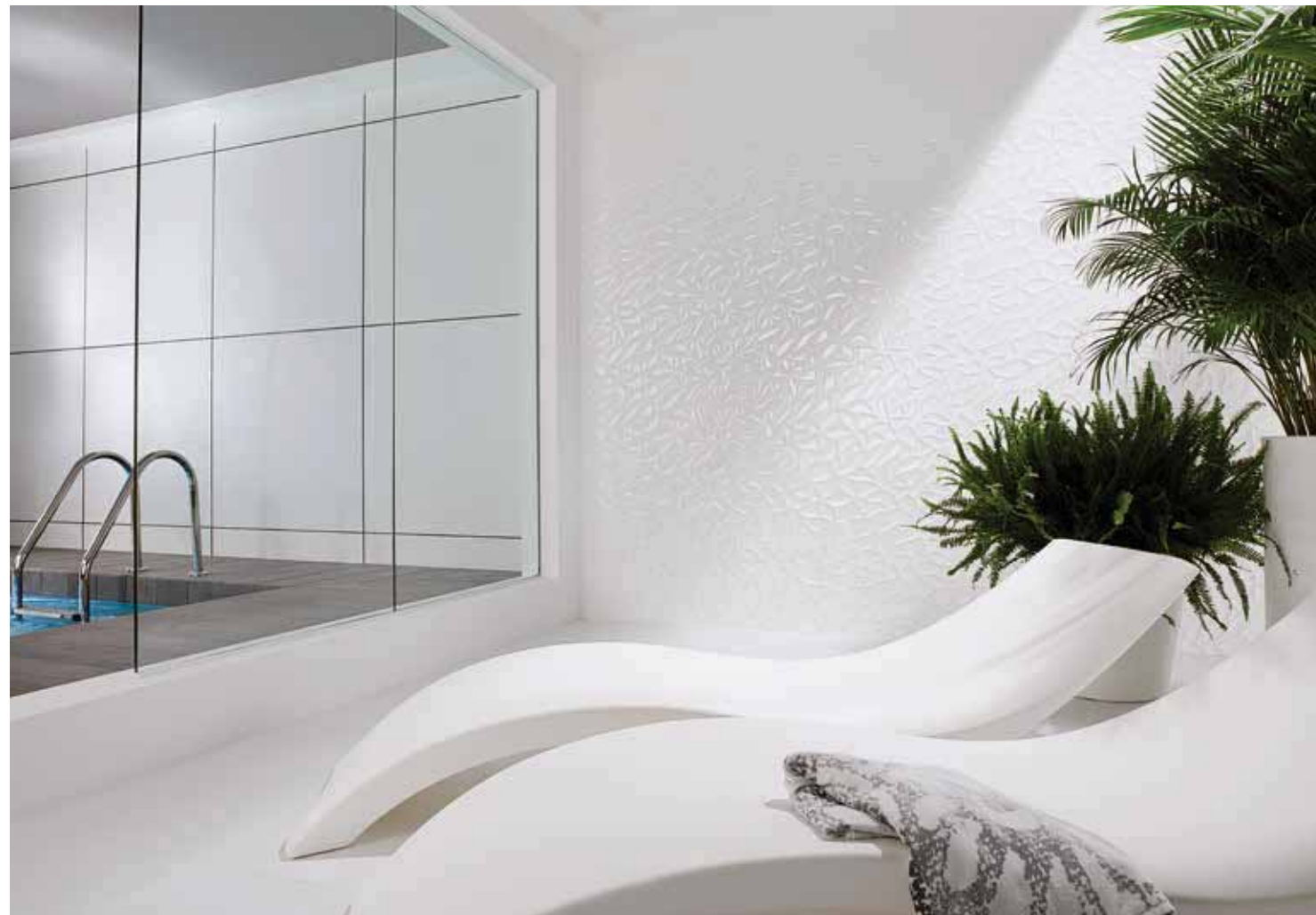
# MARMI DECO BLANCO 31,6x90cm

*valores aproximados. **approximated values.