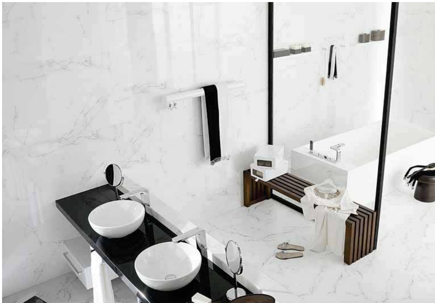
# MÁRMOL CARRARA BLANCO 31,6x90cm

PAVIMENTO COMBINABLE: SERIE CARRARA 43,5x43,5cm · PAG.205 FLOOR TILES COMBINATIONS: CARRARA SERIES 43,5x43,5cm · PAG.205