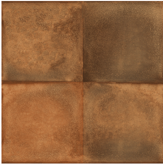
PIAMONTE SIENA F4545L