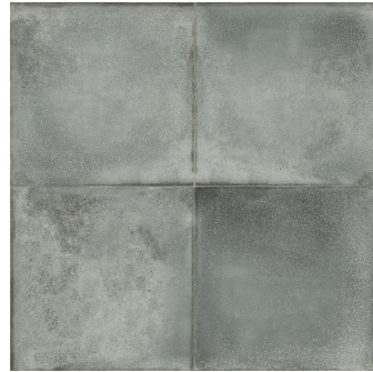
PIAMONTE HUMO F4545L